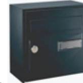
boîte aux lettres boîte aux lettres