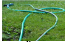
tuyau d'arrosage tuyau d'arrosage